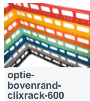
optie- bovenrand- clixrack-600